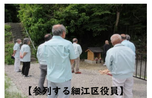
【参列する細江区役員】