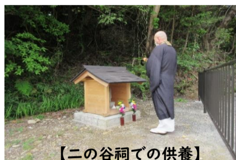
【二の谷祠での供養】