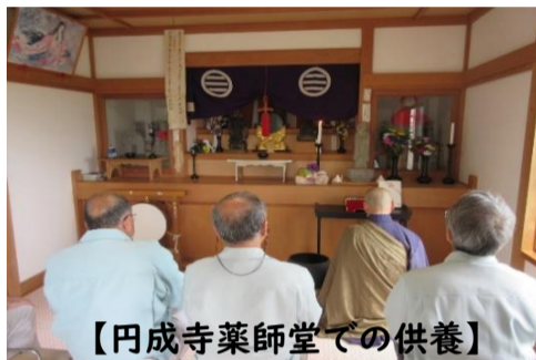
【円成寺薬師堂での供養】

二の谷の整備が完了し、祠も新しくなったので、整備期間中、円成寺薬師堂に安置されていたお地蔵様を新しくなった祠に戻し供養しました。